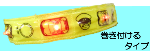
巻き付ける タイプ