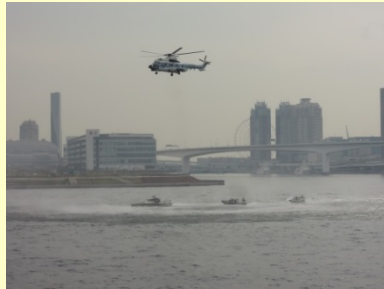
〔不審小型ボート捕捉訓練〕