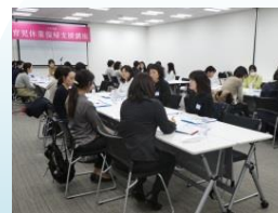
【育児休業復帰支援講座】