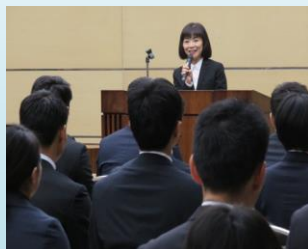
【警視庁キャリアアドバイザーによる講義】