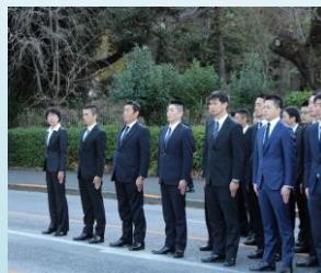
【生活安全特別捜査隊長】