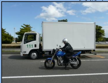
貨物車の運転席と反対側に取り付けた補助ミラーの例