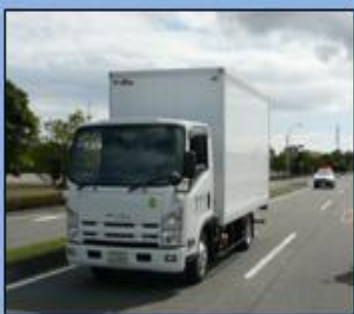
貨物車の運転席側に取り付けた補助ミラーの例

補助ミラーは、サイドミラーの角などに取り付けて、本来のサイドミラーの視界の妨げにならないようにしましょう。