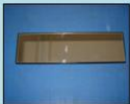
ワイドミラーの例